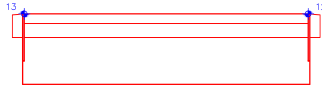
VYTÝČOVACÍ BODY V ŘEZU: