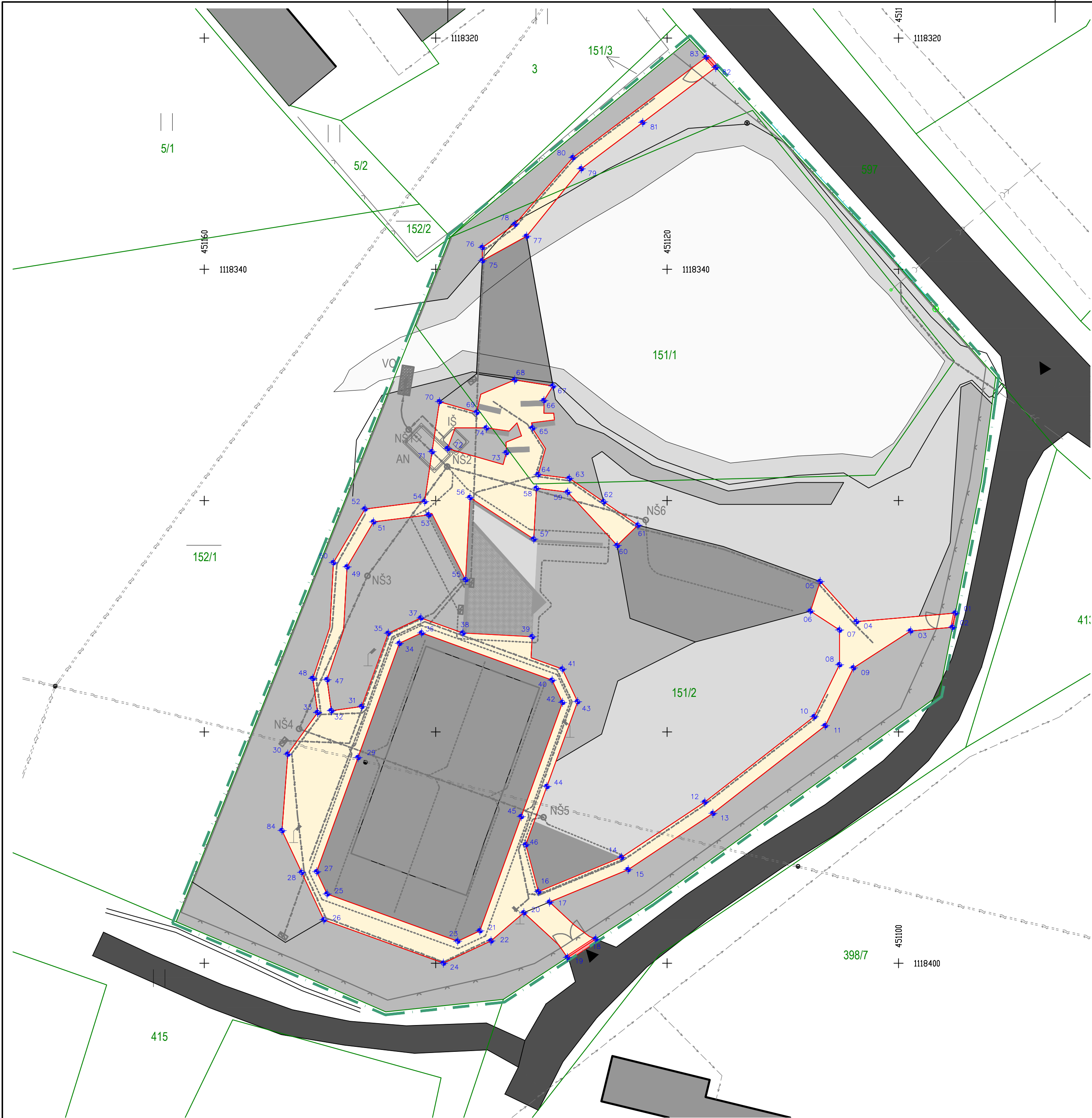
SEZNAM VYTÝČOVACÍCH BODŮ: